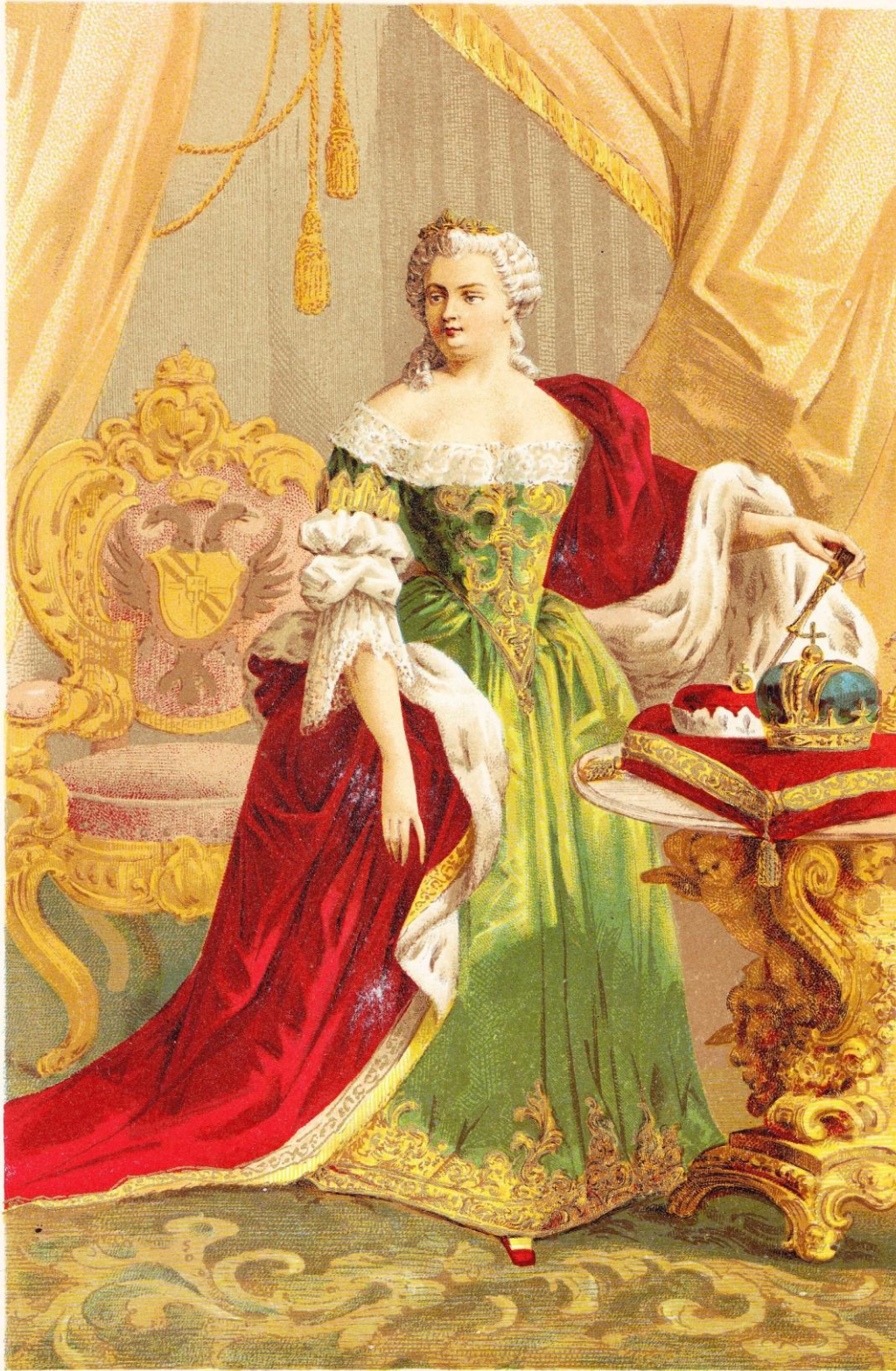
C. Severeyns, Chromolith.